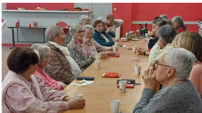
Café Entr'Elles sur le thème

«Se raconter, créer du lien : parcours de vie, identités et transmissions »