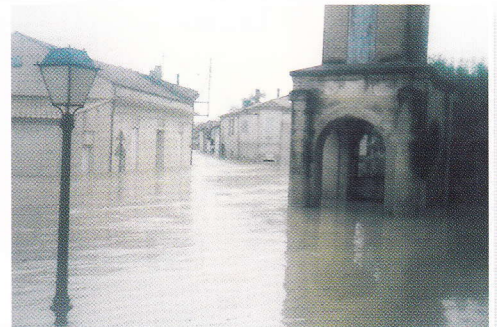
Codognan – Octobre 1988

Après la crue de référence de 1988, une digue de 1,50m de haut a été réalisée afin de protéger le village des crues courantes du Rhône. Dès lors, la plupart des crues ont pu être contenues dans le lit majeur du Rhône, bordé par la digue de protection.